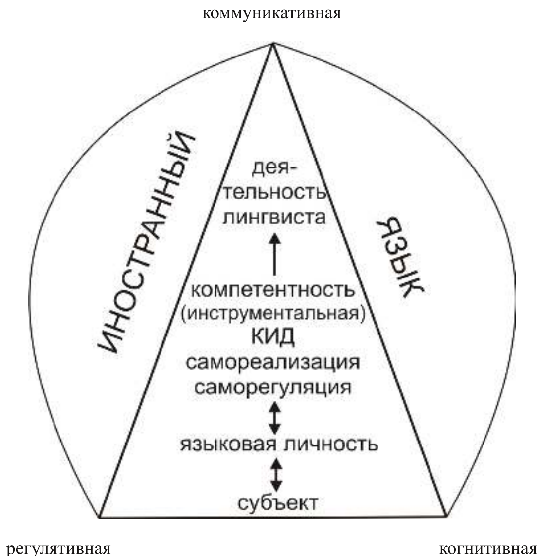
Р и с у н о к 2. Функции контрольно-измерительной деятельности

Сущность КИД определяется непосредственным воздействием: 1) на становление и развитие средствами контроля таких качеств языковой личности как пластичность, способность к саморазвитию, умение сочетать родную культуру с культурой других народов (когнитивный компонент); 2) на субъектов общения (коммуникативный компонент).