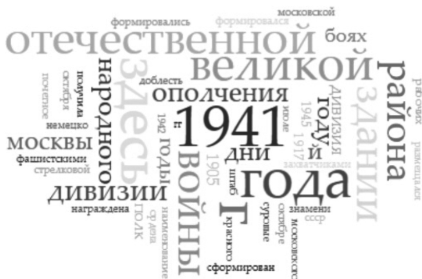
Р и с у н о к 1. Облако частотности слов в текстах мемориальных досок [F i g u r e 1. Word cloud graph based on frequency of words used in memorial plaque texts]

пространства. Данное событие выступает в качестве объекта коммеморации, а место локализации коммеморации в городском пространстве объективировано такими языковыми единицами как здесь, здании, района, Москвы . К концептуальному полю ВОЙНА также относятся наиболее частотные лексемы дивизии и народное ополчение . Основные выводы, которые позволяет сделать анализ абсолютной частотности упоминания слов в тексте, заключаются в следующем: коммеморация исторических мест в городском пространстве в текстах мемориальных досок связана с ВОВ, реализуется различными языковыми средствами, относящимися к концептуальному полю ВОЙНА. Представленные выводы отличаются некой схематичностью и упрощенностью, хотя и позволяют прийти к заключению о доминирующем историческом событии, репрезентированном в коммуникативном дискурсе мегаполиса, что требует использовать дополнительные параметры для анализа пространственно-временных особенностей коммеморации в городском коммуникативном пространстве.